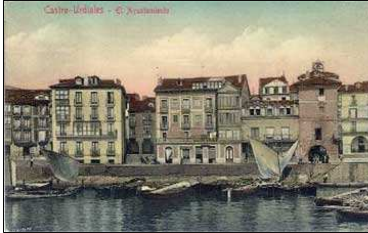
Ayuntamiento de Castro.

escabeches (4). En abril de 1735 los "tratantes y comerciantes en pescados frescos y salados" pidieron al Ayuntamiento una rebaja en los derechos del aceite y vinagre de los escabeches, pues de lo contrario se verían "precisados a no comprar las pescas" (5). Durante toda la segunda mitad del siglo XVIII, además de seguir gravados el aceite y vinagre, la arroba de escabeche estuvo cargada con 4 maravedíes (6) .