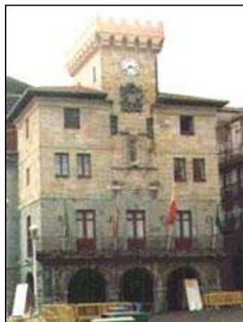
Ayuntamiento de Castro Urdiales

Durante mucho tiempo había sido costumbre el uso libre de la sal, viniera de donde viniese. No obstante, en el año 1578 la Junta de las Cuatro Villas reunida en Laredo se alarmaba por la posibilidad de que aquel tráfico libre salinero de la costa variara. En la reunión argumentaba que con el posible cambio cesaría el progreso pesquero. De lo contrario "(...) por que en ponerse los alfolís en estas Cuatro Villas como se pretende las viene/ muy gran dano y perjuizio y total perdición irreparable por que todo su trato y comercio/ de la pesquería a que en ella hay por no tener otro aprovechamiento ninguno y po-/niéndose los dichos alfolís en dichas Cuatro Villas cesaría las dichas pesquerías ANSI/ las que se hazen en las dichas Cuatro Villas como las que se azen a Irlanda, Cabo de Clerguer/ y Terranova... " (3). En el fondo era un problema fiscal, pues de gravarse la sal, los marineros, decían las Cuatro Villas, se irían a otras zonas de baja presión tributaria, como el País Vasco, el Rey se quedaría sin naves y tripulaciones, y sus fronteras desguarnecidas (4).